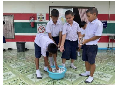
ภาพที่ 3 ล้างทำความสะอาดสายเป่าเมโลเดียน

จากภาพที่ 3 การทำความสะอาดเครื่องดนตรี เพื่อให้เครื่องดนตรีสะอาด และยืดอายุการใช้งานของเครื่องดนตรี ผู้เรียนได้เรียนรู้เรื่องการดูแลรักษาเครื่องดนตรี และฝึกเรื่องระเบียบวินัย