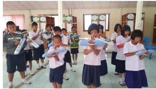
ภาพที่ 1 การใช้นิ้วมือกำหนดเสียงดนตรี และฝึกปฏิบัติบรรเลงเมโลเดียน

จากภาพที่ 1 กิจกรรมการปฏิบัติเครื่องเมโลเดียนพื้นฐาน โดยจะมีการถือเมโลเดียน และวางมือให้ถูกต้องตรงตามตำแหน่ง เพื่อให้ผู้เรียนกดได้ตรงเสียงที่ครูกำหนด และสามารถบรรเลงเพลงที่กำหนดได้ถูกต้อง โดยใช้ทฤษฎีการสอนจากง่ายไปหายาก