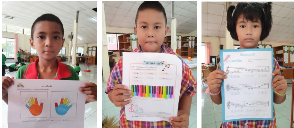
ภาพที่ 4 ใบความรู้ดนตรีเกี่ยวกับตำแหน่งของนิ้วมือ

จากภาพที่ 4 ตำแหน่งของนิ้วมือทั้ง 5 นิ้ว ลิ่มเมโลเดียนทั้ง 7 เสียง ซึ่งจะใช้สร้างสื่อการสอนเพื่อให้ผู้เรียนจดจำได้ง่ายขึ้นผ่านสี และการอ่านโน้ตบนบรรทัด 5 เส้น ผู้เรียนจะได้เรียนรู้เรื่องเสียงผ่านสี เพื่อใช้ให้จดจำโน้ตได้ง่ายขึ้นโดยใช้ทฤษฎีสีในการเรียนรู้